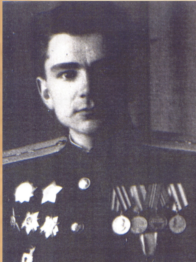
Первый снимок мирного времени Берлин, 1945

Война постепенно отдаляется вместе с теми, кто видел ее воочию. Все меньше остается свидетелей и очевидцев героических событий и все труднее давать достойный опор разного рода разоблачителям и правдоискателям. В 1945 году наши отцы, деды и прадеды защитили весь мир от фашизма. Теперь мы должны защитить нашу Победу, во имя тех, кто отстоял нашу честь и свободу и воздать должное тем, кто сегодня считает, что « есть такая профессия—Родину защищать ».