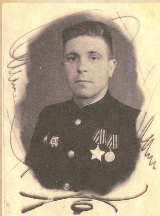
Топорков Александр Семенович