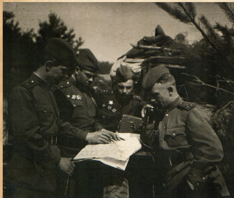
перед форсированием Одера 19.04.1945