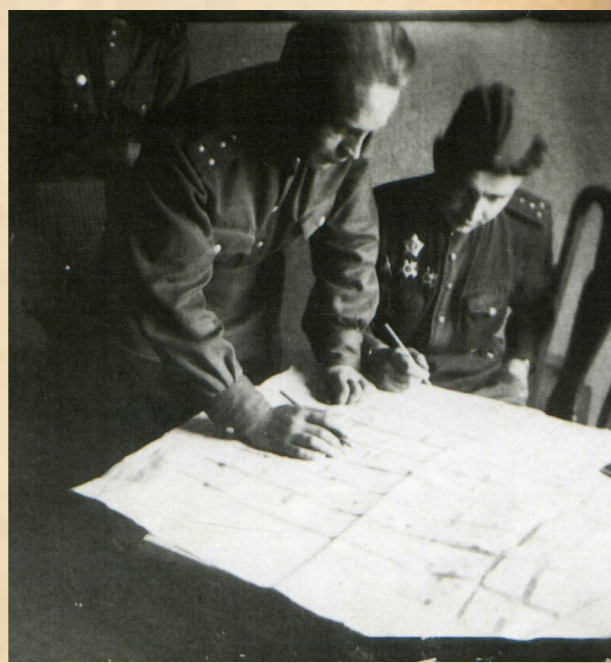
Разработка операции на Берлинском направлении 01.03.1945

В 1942 году окончив курсы младших лейтенантов, воевал в составе Северо-Западного, а затем Первого Белорусского и Калининского фронтов. До Берлина дошел в звании капитана. Он одним из первых оставил автограф на стене рейхстага. Был дважды ранен и контужен, но каждый раз возвращался в строй.