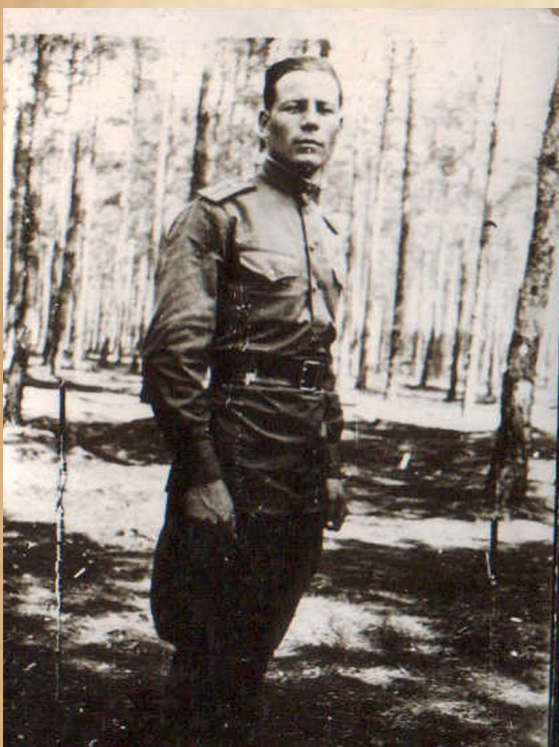
В лесу под Берлином